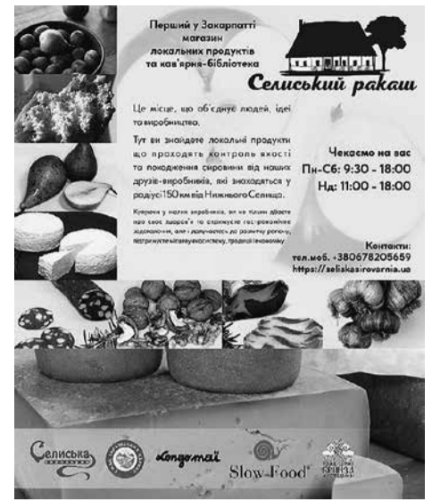
Flyer voor de winkel Selitske Rakash

Gezien de omvang van deze vragen was ons antwoord pragmatisch en aangepast aan onze mogelijkheden. We stelden ons een winkel voor met lokale producten van boeren en ambachtslieden, die traditioneel ecologisch werken. We wilden alle smakvolle specialiteiten uit alle hoeken van dit land bij elkaar brengen. 22 producenten binnen een straal van 150 km rond Nizjné Sélisjtsjé hebben nu 200 verschillende producten uitgesteld in deze winkel. De producten zijn geselecteerd op hun kwalitatieve, ecologische en sociale waarde. De boer of boerin moet zelf bij de productie betrokken zijn. Het product hoeft niet specifiek afkomstig te zijn van 'biologische' landbouw. We weten al te goed dat er in alle seizoenen biologische tomaten te koop zijn, maar zulke productiemethodes zijn eerder een ramp dan een redding voor de planeet.