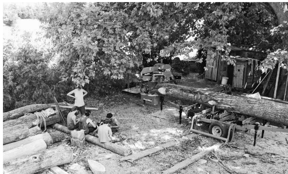
Het hout van de gekapte rij oude populieren wordt gebruikt om een nieuw dak op het oude woonhuis van de Mas de Granier te zetten.