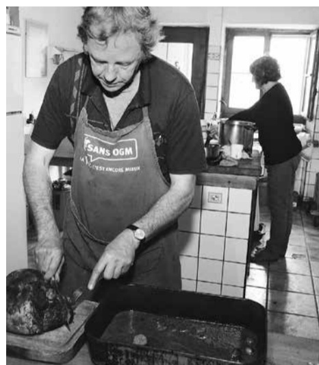
Samen koken voor de collectieve maaltijden