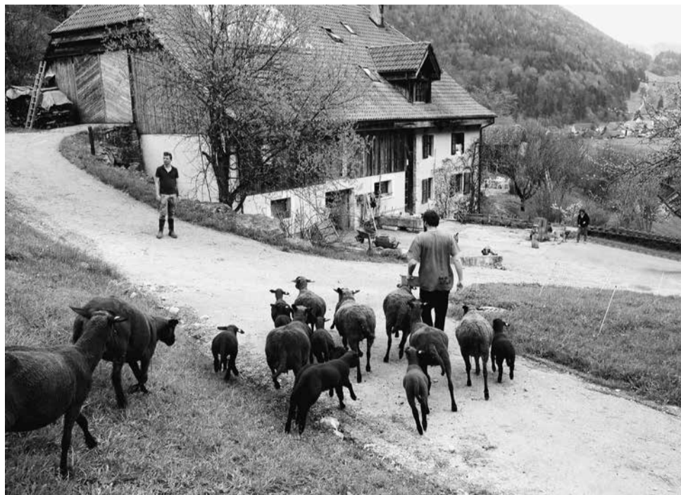
Op de kleinschalige boerderij Le Montois in de Zwitserse Jura speelt de schapenhouderij een belangrijke rol. Het ras 'Roux de Berne' levert een mooie bruinrode wol en kan goed tot breiwool worden verwerkt.

Als een dichte mist heeft de coronacrisis alle mogelijke thema's die ons betreffen aan het zicht van het publieke debat onttrokken. De fundamentele kwesties van onze samenleving zijn op de lange baan geschoven. Dat geldt ook voor de manier waarop ons voedsel wordt geproduceerd.