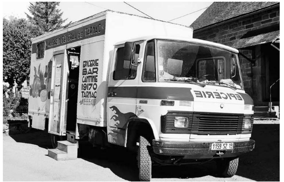
De dorpswinkel zet zich in beweging

Een inval van de politie in november 2008 en de onzinnige arrestatie van enkele van onze vrienden zetten onze kleine stappen in Tarnac in een kwaad daglicht en gaf ons een onverwachte reputatie. Het is niet de eerste keer in Frankrijk dat een collectief