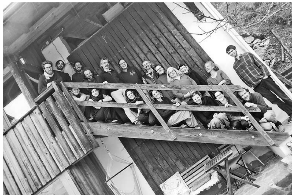
De deelnemers kwamen van de collectieven Wieserhoisl, Nikitsch, de Zwetschken, Takern2, Neuohof, SSM en Longo maï.