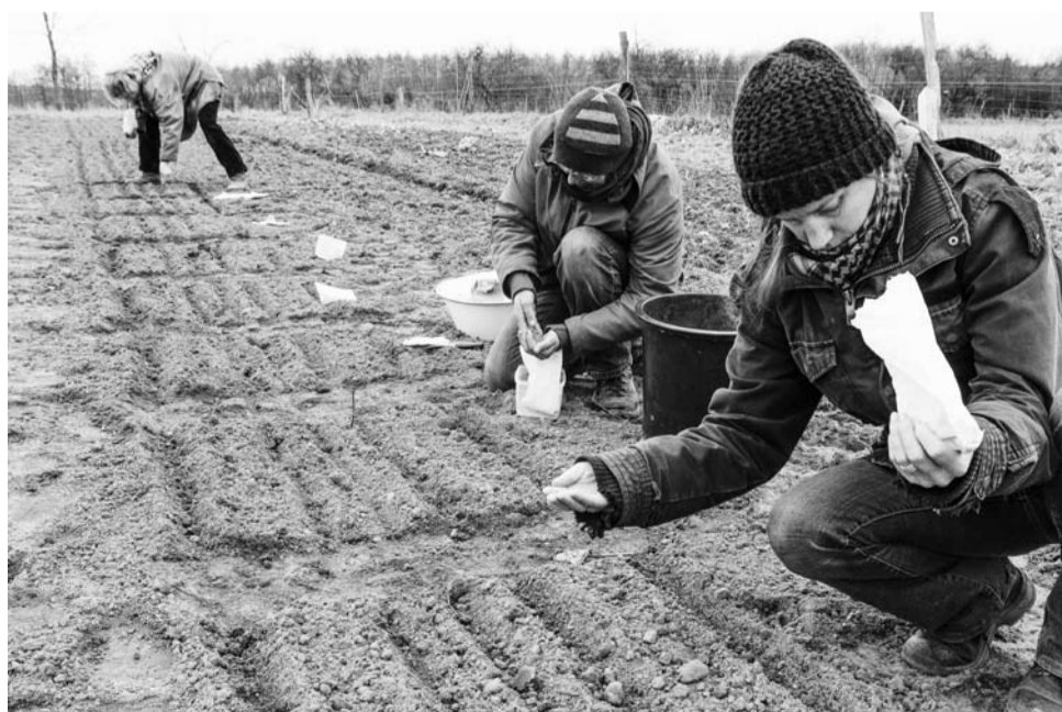
Bijna tachtig tarwerassen uit onze collectie oude graansoorten werden begin maart in onze kijktuin op Hof Ulenkrug gezaaid. Om de kiemkracht van een ras in stand te houden, moet het graan om de paar jaar worden geteeld.

Toen de EU met plannen kwam de vermeerdering van niet-geregistreerde soorten en de vrije ruil van zaaigoed aan banden te leggen, protesteerden duizenden mensen in heel Europa. Zo kon dit wetsvoorstel worden verhinderd. Nu gaat de