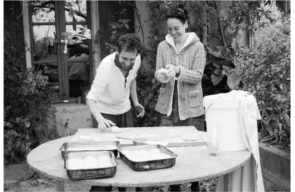
De eerste lentedagen geven zin zoete broodjes te bakken

Op het veld dat we tien jaar geleden dankzij de hulp van de Longo maï-vriendenkring konden kopen, verbouwen we gewassen in de volgende vruchtwisseling: twee jaar de vlindebloemige esparcette die met haar wortelknolbacteriën het jaar daarop de tarwe stikstof ter beschikking stelt. In het vierde jaar bloeit het veld lila en oogsten we de erwten voor de kippen. Daarna komt de durumtarwe aan de beurt voor het maken van verse pasta. Gerst is de laatste cultuur in deze zesjarige vruchtwis-