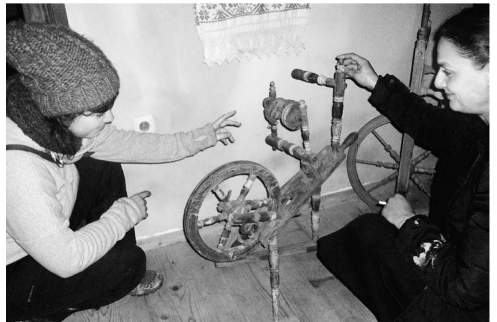
Voor de één is het een museumstuk, voor de ander een noodzakelijk werktuig: het houten spinnewiel.

ten we eind januari een reis van een week in deze streek. We deden mee aan de workshop 'Textielverwerking in de Harbachvallei' en konden de oude traditionele textielverwerking vergelijken met moderne installaties op dit gebied. De mensen ter plaatse begeleidden ons naar talrijke projecten en we hadden een zeer interessante en intensieve tijd met elkaar. In Sibiu bezochten we een moderne