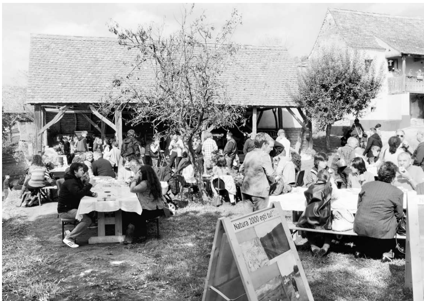
Een "Transsylvania Brunch" vindt elke maand van april tot september plaats in een dorp in Transsylvanië rondom het een of andere thema. De groep uit Hosman maakt deel uit van dit initiatief.