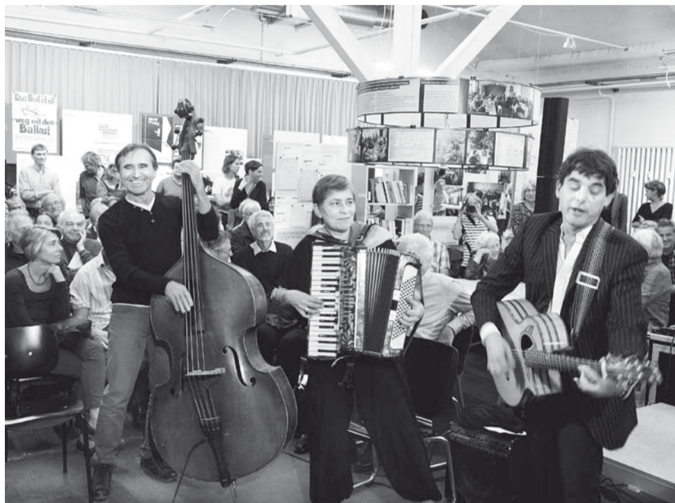
Comedia Mundi, de muziekgroep van Longo mai, zorgde voor een goede sfeer tijdens de opening van de tentoonstelling in Bazel.

Aanvankelijk was niet iedereen in Longo mai even enthousiast over het idee een tentoonstelling over de 40 jaar Longo mai te maken.