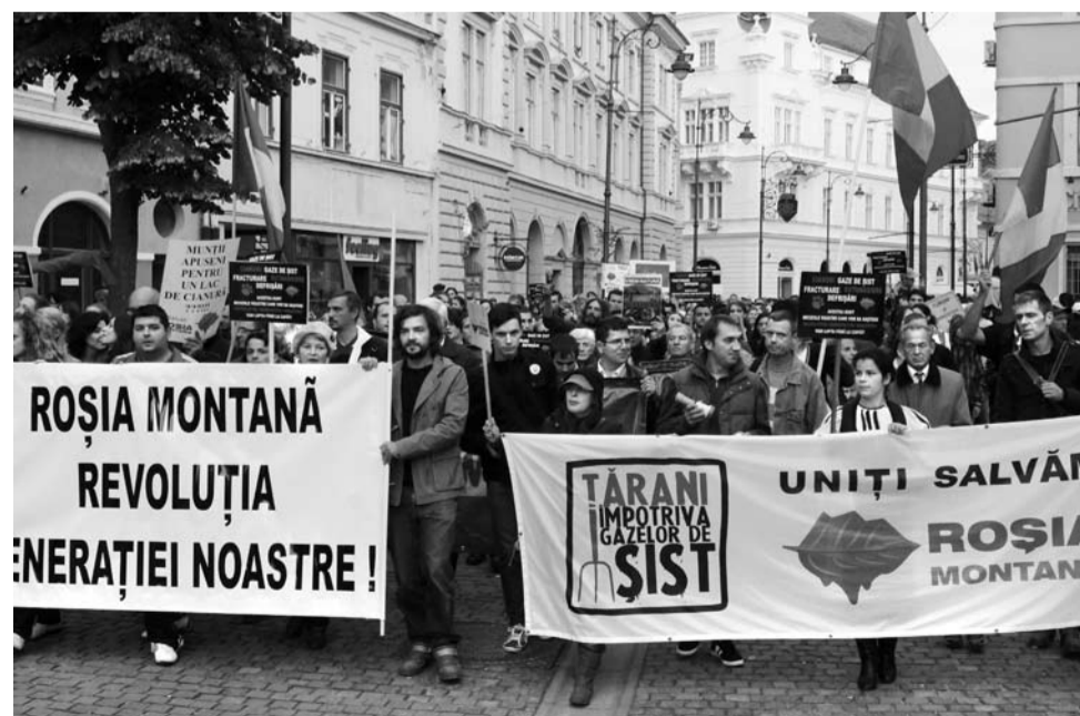
Demonstratie in Sibiu tegen de goudmijn van Roșia Montană en tegen de boringen naar schaliegas.