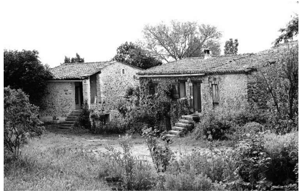
Bij het restaureren van de vakantiehuisen is de traditionele bouwstijl gerespecteerd.

Vijfendertig jaar geleden, in 1979, hebben we met de hulp van onze vriendenkring een klein bouwbedrijf in Forcalquier geholpen met het opbouwen van de ruïnes van het gehucht Les Magnans. Het dorpje met wat nu vakantiehuisjes zijn, ligt op 14 km afstand van de coöperatie in Limans. Elk jaar is het hier een komen en gaan van gasten. Familie en vrienden komen ons en de coöperatie hier in de Provence bezoeken en genieten van de charme van de streek. Twee grote huizen kunnen groepen behoeven. Hier worden cursussen en vergaderingen gehouden en verjaardagen en bruiloften gevierd. Steeds vaker wordt er een beroep gedaan op onze uitmunten-