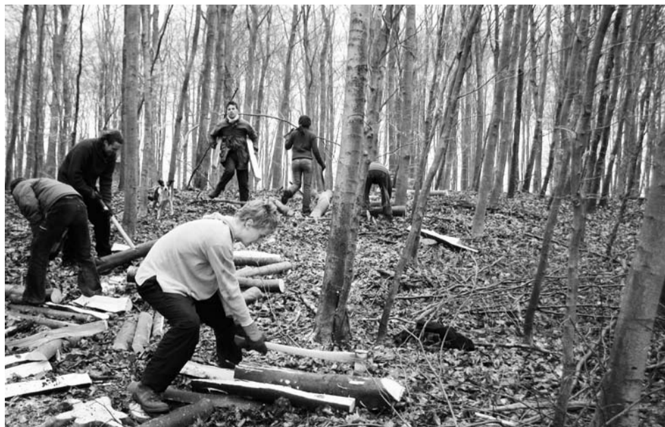
Een tiental jonge mensen uit de Zuidfranse en Zwitserse coöperaties kwamen in januari hout hakken op Hof Ulenkrug. De houtvester had ons een stuk jong bos aangewezen om uit te lichten. In deze weken praatten we ook veel bij over de landbouwactiviteiten in onze coöperaties en over de opleidingsmogelijkheden in de verschillende bereiken.