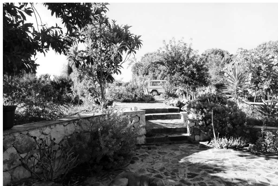
Het terras voor het huis biedt genoeg plaats en schaduw voor talrijke ontmoetingen en bijeenkomsten.