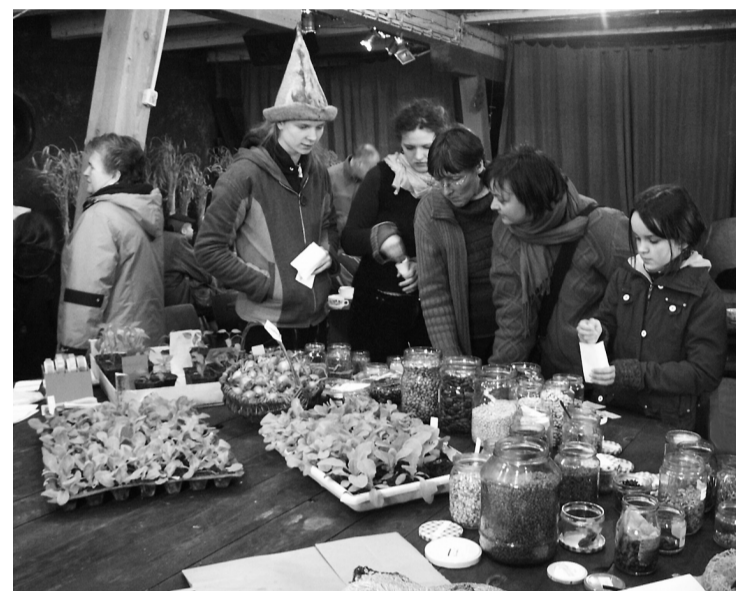
In het kader van "Kultur im Kuhstall" vond op de Ulenkrug in april een zaaigoed- en plantenbeurs plaats.

werd een groot deel van de gentechnisch veranderde tarwe omgehakt door zes mensen, die daar openlijk voor uitkwamen. De genenbank heeft trouwens de proef niet afgebroken, maar alleen een verklaring uitgegeven, waarin wordt