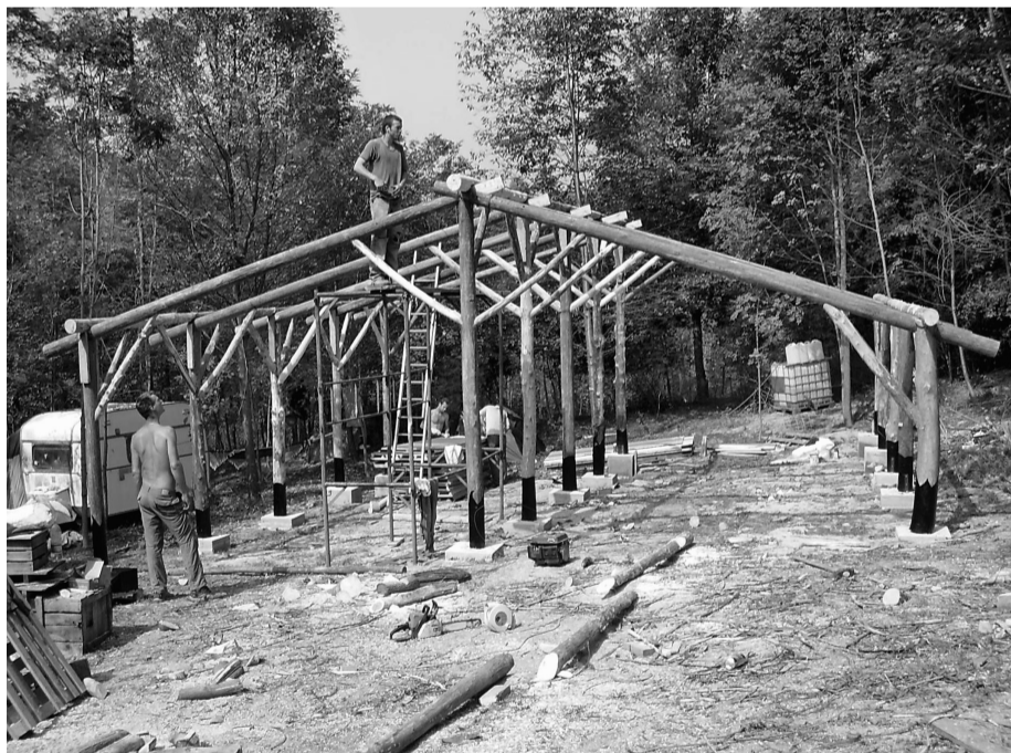
Zomer 2007: Het houten geraamte voor de schaapskooi in Ca dj' Mat in bouw

*Ca dj' Mat betekent in het dialect "het huis van de gekken"