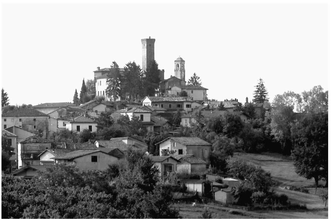
Het dorp Roccaciglié in de heuvels van de Piëmont

In de toekomst moeten we kunnen voorzien in een groot deel van onze behoeften door een moestuin, het houden van kippen, konijnen en varkens en door de oogst en verwerking van in het wild groeiende planten en medicinale kruiden. Culturele activiteiten spelen eveneens een belangrijke rol voor ons. We zijn van plan workshops te organiseren, films te vertonen en boeken en teksten over alle mogelijke politieke en sociale thema's met elkaar te lezen en te bespreken. De gemeente Roccaciglié (waar we in een klein huisje wonen) telt ongeveer 100 inwoners, is gelegen in een gebied met hoge heuvels, met een rijke traditie aan wijnbouw waar paardenkracht werd ingezet en een kleinschalige veeteelt voor de zelfverzorging. In de jaren zestig en zeventig, toen de industrie zich sterk ontwikkelde in Noord-Italië, verlieten veel jonge men-