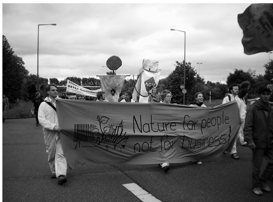
Een bonte optocht trok door de buitenwijken van Leverkusen naar het hoofdkantoor van Bayer, één van de grootste agrochemische concerns in Europa.

seerden onder meer van 16 tot 18 mei in Nizjné Selsjtsjé een kindertheaterfestival met de naam "Ptakh" ("Vogel"). Op het programma stonden theatervoorstellingen, spelletjes en verschillende activiteiten voor de kinderen van ons dorp en de omgeving. Jürgen is met meerdere mensen uit Transkarpatië ook nog betrokken bij de situatie van de vluchtelingen en migranten in de Oekraïne. Veel vluchtelingen uit het Oosten, maar ook