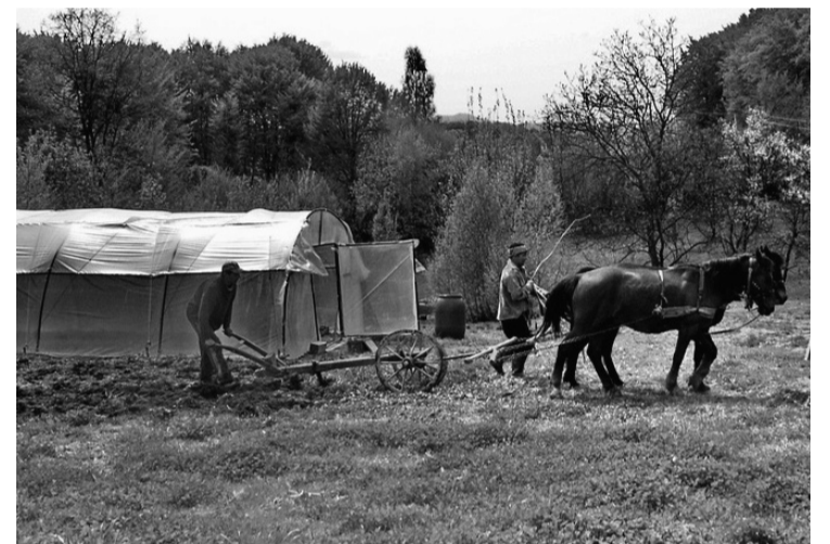
Het ploegen van de tuin doen we, zoals vaak nog in de streek, met het paard

kens, 3 biggen, een geit om te melken en twee geitjes, waarvan "Kalinka" een cadeau is van onze vrienden van Hof Stopar in Karinthië. We hebben haar over de grens met de Oekraïne moeten smokkelen. Haar