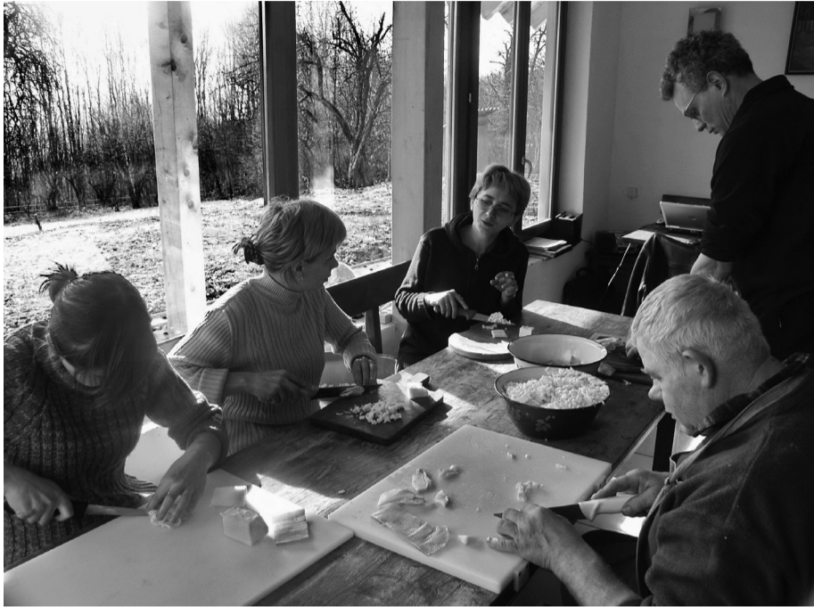
Iedereen doet mee om de kilo's spek voor de productie van de salami te snijden

een regelmatige nieuwsbrief over de situatie aan de grenzen te maken, contacten in binnen- en buitenland te leggen en de eerste stappen te ondernemen om een sociaal-medische opvang op poten te zetten.