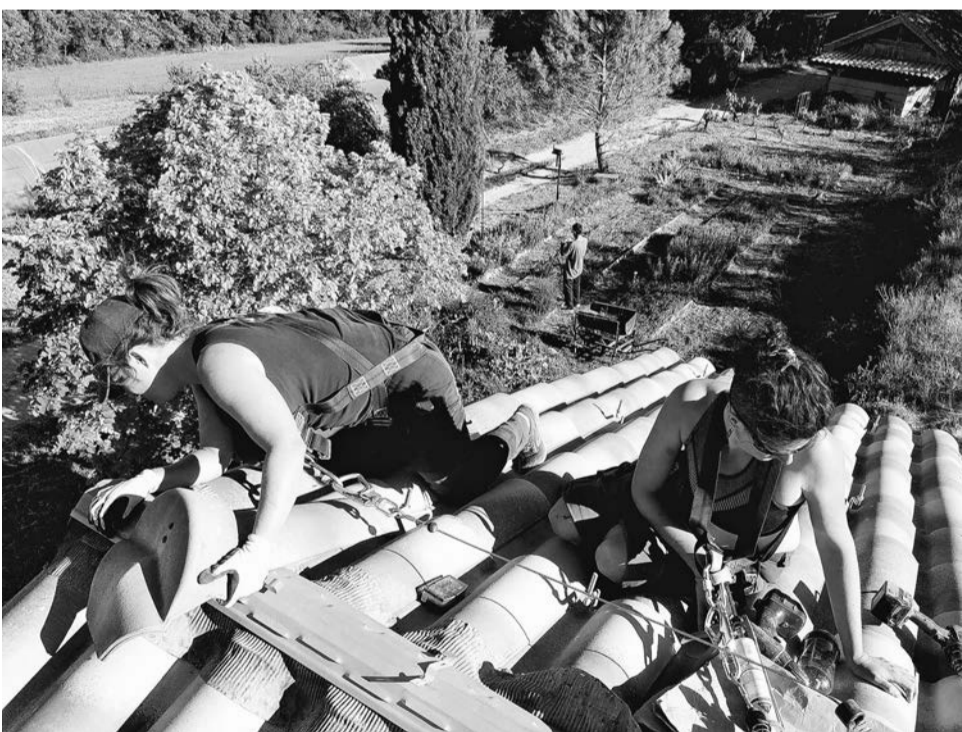
Met zekerheidsgordels om wordt er op het dak van de wijnkelder hard gewerkt.

Longo maï praat al heel lang over energieautonomie. Afgelopen april hebben we in de coöperatie de Cabrery in de Luberon vijf dagen gewerkt aan het project om fotovoltaïsche panelen te installeren.