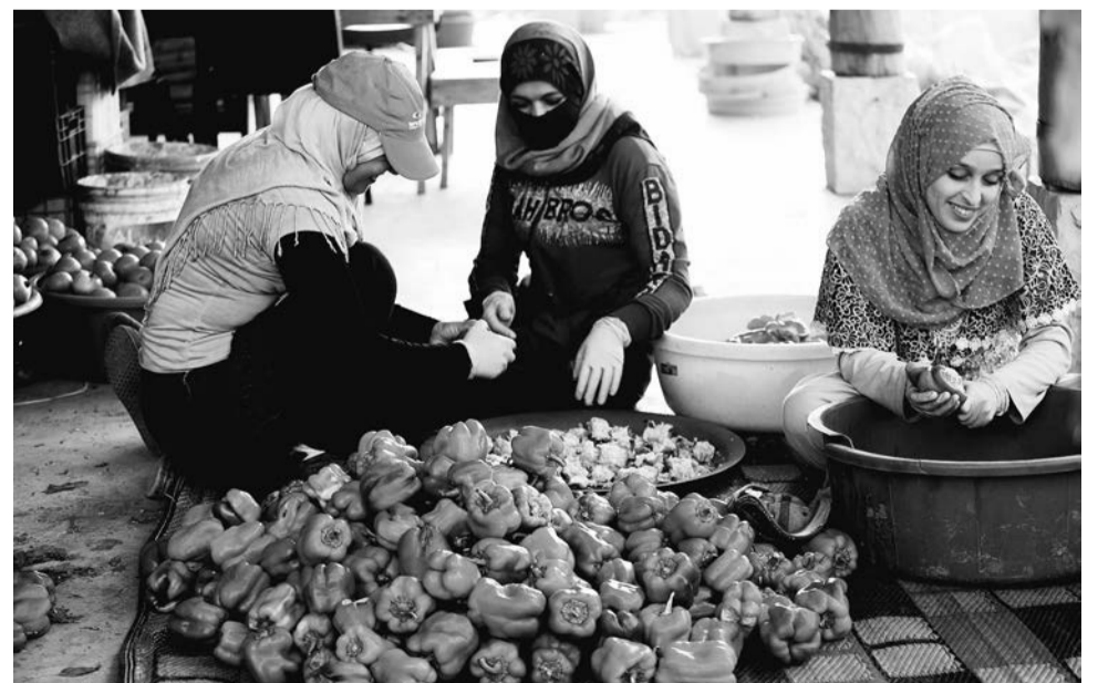
Het winnen van paprikazaad.