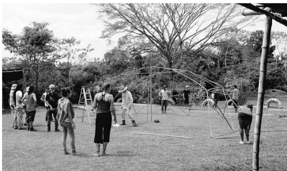
Vorbereidingen voor een feest op de Finca Sonador.