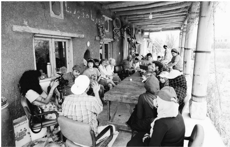
Elke maandagmorgen bespreken alle bij het project betrokken mensen en de bezoekers de activiteiten van de week onder het voordak van het zaadhuis.