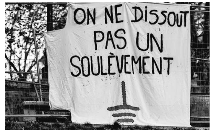
Je kunt een opstand niet ontbinden