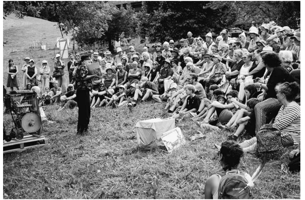
Jong en oud deelden vele mooie momenten met ons op deze prachtige dag.

Tohu-Bohu Company deed jong en oud hardop lachen, terwijl de muzikanten van Simili hun programma 'Danube mon amour' speelden in de schaapskooi. De kinderen hadden hun eigen speelplaats en de decoraties nodigden uit tot contemplatie. Een vogel van wol en riet zweefde boven onze hoofden en waakte over onze festiviteiten. Natuurlijk vergde deze grote viering veel voorbereiding. Een jaar geleden werd in de coöperatie Cabrery een speciale wijn aangezet voor de 50e verjaardag, die nu op 8 juli voor het eerst werd verkocht. Mensen uit heel Longo maï gaven ons onschatbare steun. Deze solidariteit was essentieel bij zowel de voorbereiding als de organisatie van dit feest. Uiteindelijk blijven we achter met het ietwat vreemde gevoel van een geweldig festival dat, na zoveel maanden voorbereiding, eigenlijk te kort duurde. Wat overblijft zijn de levendige indrukken van kleur, emotie, muziek en, natuurlijk, de vreugde om zoveel mensen te zien. Terwijl we bezig waren met de voorbereidingen voor deze dag, nam