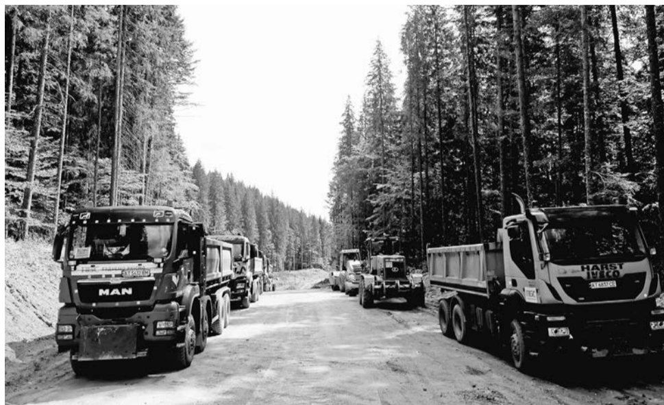
De verwoestingen in het natuurgebied van de Svydovets houden niet op.

Ons land wordt al meer dan anderhalf jaar geteisterd door oorlog en we weten niet hoe lang die nog zal duren. Terwijl sommige mensen aan het front staan, helpen anderen vluchtelingen in het binnenland. Helaas blijven tegelijkertijd de oligarchen profiteren van de situatie.