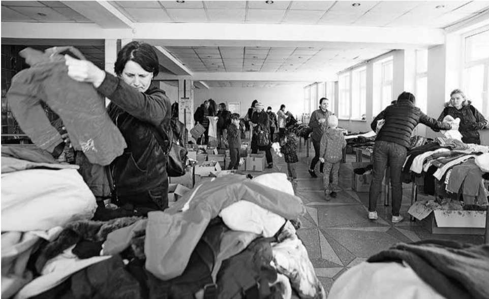
Hulpgoederen worden gesorteerd en verdeeld in het cultuurhuis van Nizjne Selisjtsje.

Op de ochtend van 24 februari werden we gewekt door de oorlog. Rusland viel Oekraïne binnen. Het begin was verschrikkelijk.