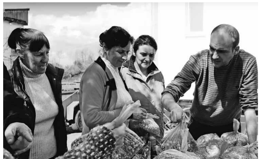
In een oorlog is het voorhanden hebben van zaden voor de eigen voedselproductie een kwestie van overleven.