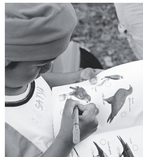
Als ik een vogeltje zou zijn...

Eind mei kwamen meerdere mensen uit alle coöperaties bij ons in Hosman bijeen om te bespreken met welke perspectieven we ons in de Oekraïne willen inzetten. Dat was niet gemakkelijk. Voor velen van ons (en ik ben een van hen) is van het iconische beeld van Rusland als bevrijder van het nationaal-socialisme alleen nog maar een hoopje gebroken stukken over. Wat niet lukte met de verwoesting van Grozny, de permanente militaire aanwezigheid in Transnistrië, de