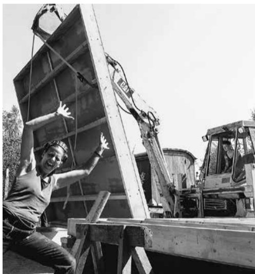
De eerste vloerplaat wordt gelegd...

bachtslieden intensieve besprekingen gevoerd over de vraag hoe wij alles onder één dak konden krijgen. Waar haal je water en elektriciteit vandaan en hoe verwarm je je? In januari 2020 waren we eindelijk zo ver dat we een lijst hadden met de