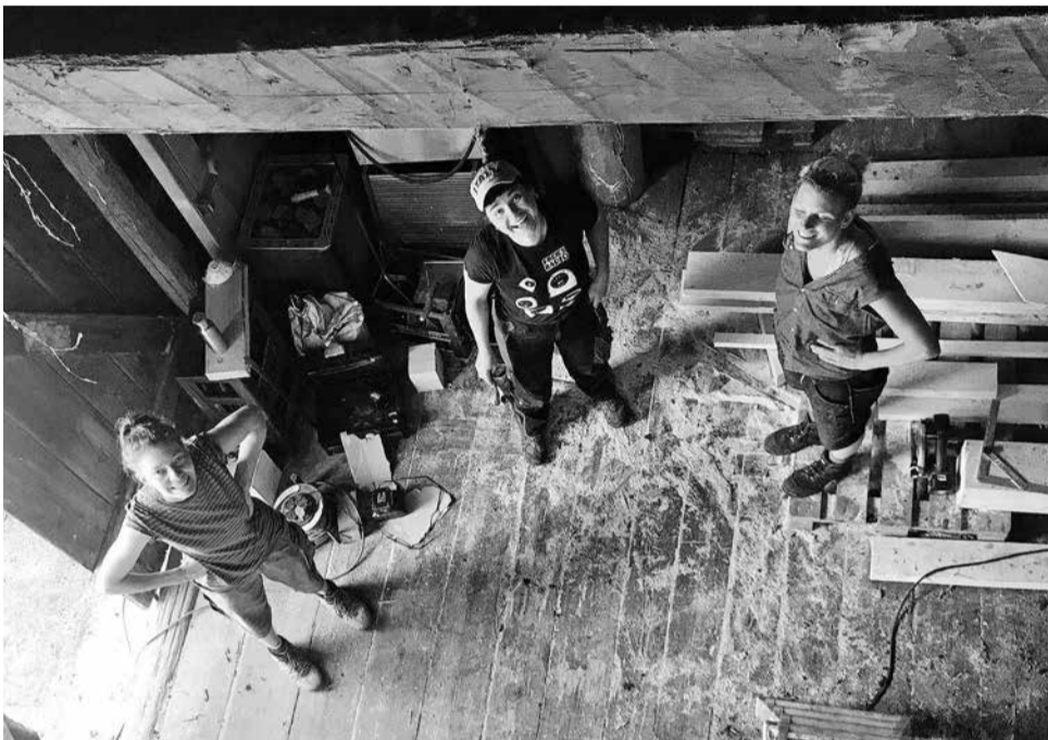
Met de bouw van het dak bereidt het GemSe-team zich voor op de komende winters.