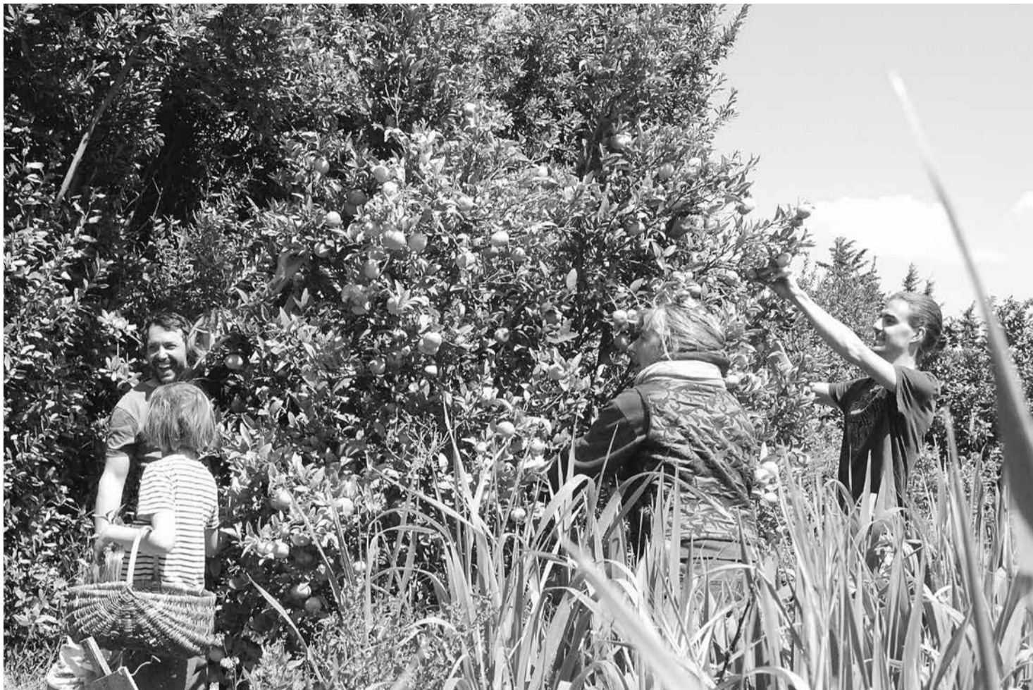
De hele winter door en tot in het late voorjaar kunnen we citrusvruchten plukken, zoals deze mandarijnen eind april.