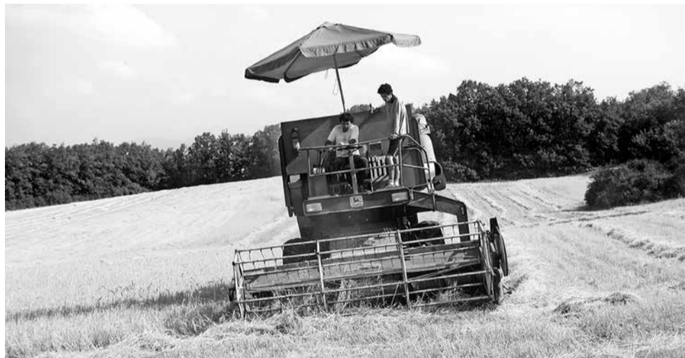
Onze oude combine heeft het na dertig dienstjaren helaas deze zomer echt opgegeven. Gelukkig kwam een boer uit de omgeving te hulp.

De Longo mai-coöperatie in Limans (Provence) is de grootste van onze beweging, en ook de meest gediversifieerde.