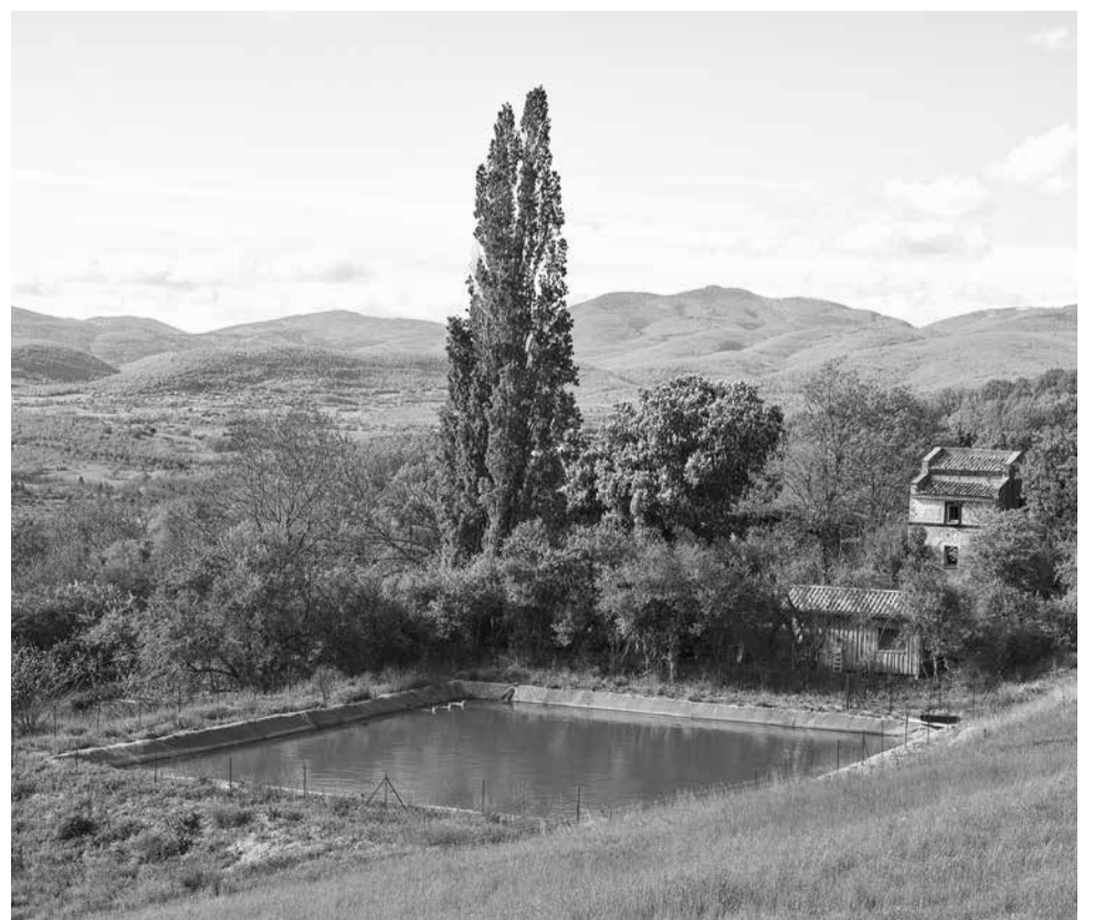
De vijver bij de Pigeonnier, een van de drie nieuwe waterreservoirs voor de irrigatie van de gewassen.