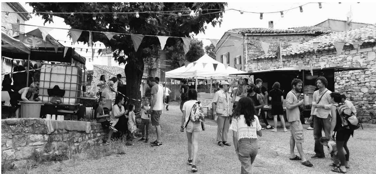
In juni werd het einde van het schooljaar gevierd in Limans.