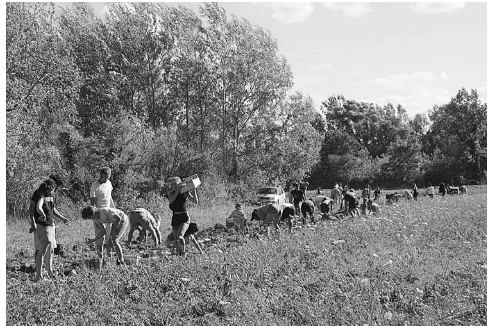
Met vereende krachten worden aardappelen geoogst voor de solidaire voedselverdeling in de streek.

De zestien steden en gemeentes die momenteel aan de alliantie deelnemen, willen dat Zwitserland meer vluchtelingen opneemt en zijn bereid