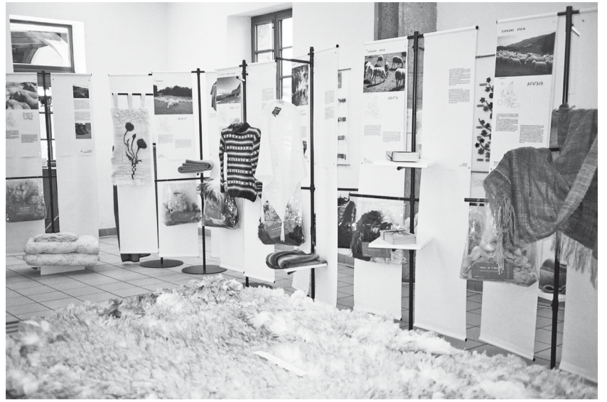
De tentoonstelling over de wol in het Franse Rambouillet. We hopen er eens mee naar het textielmuseum in Tilburg te komen...

ATELIER / Longo maï Filature de Chantemerle 05330 St. Chaffrey atelier5@orange.fr