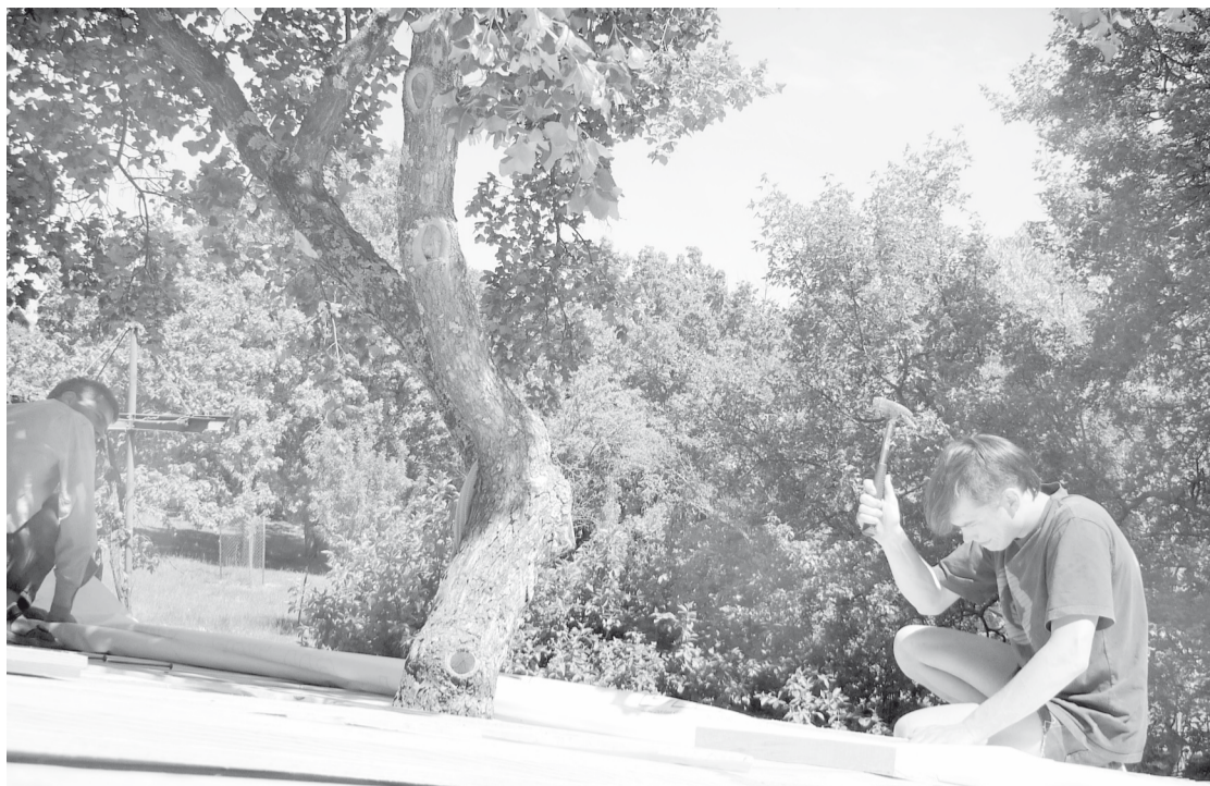
Timmeren op het nieuwe dak van de oude houthakkershut op de Zinzine. De ahorn die door het dak groeit, mag blijven staan.