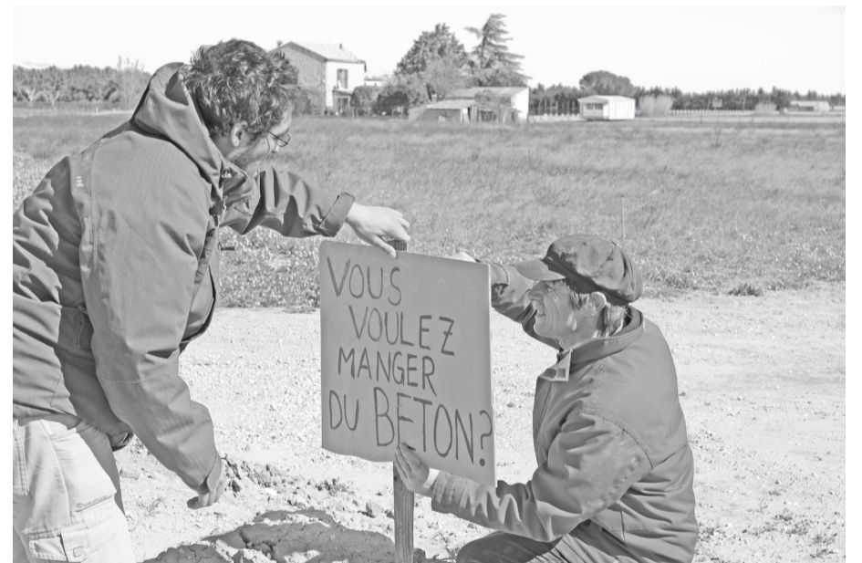
Wilt u beton eten? Actie tegen de bebouwing van landbouwgrond bij Tarascon.

"Fleurs contre béton à Tarascon" was de titel op de hoofdpagina van de belangrijkste streekkrant "la Provence" op 7 mei 2010. Het artikel handelde over de eerste actie van het "Collectif Terre fertile" (Collectief vruchtbare aarde). Ook mensen van de Mas de Granier waren van de partij.